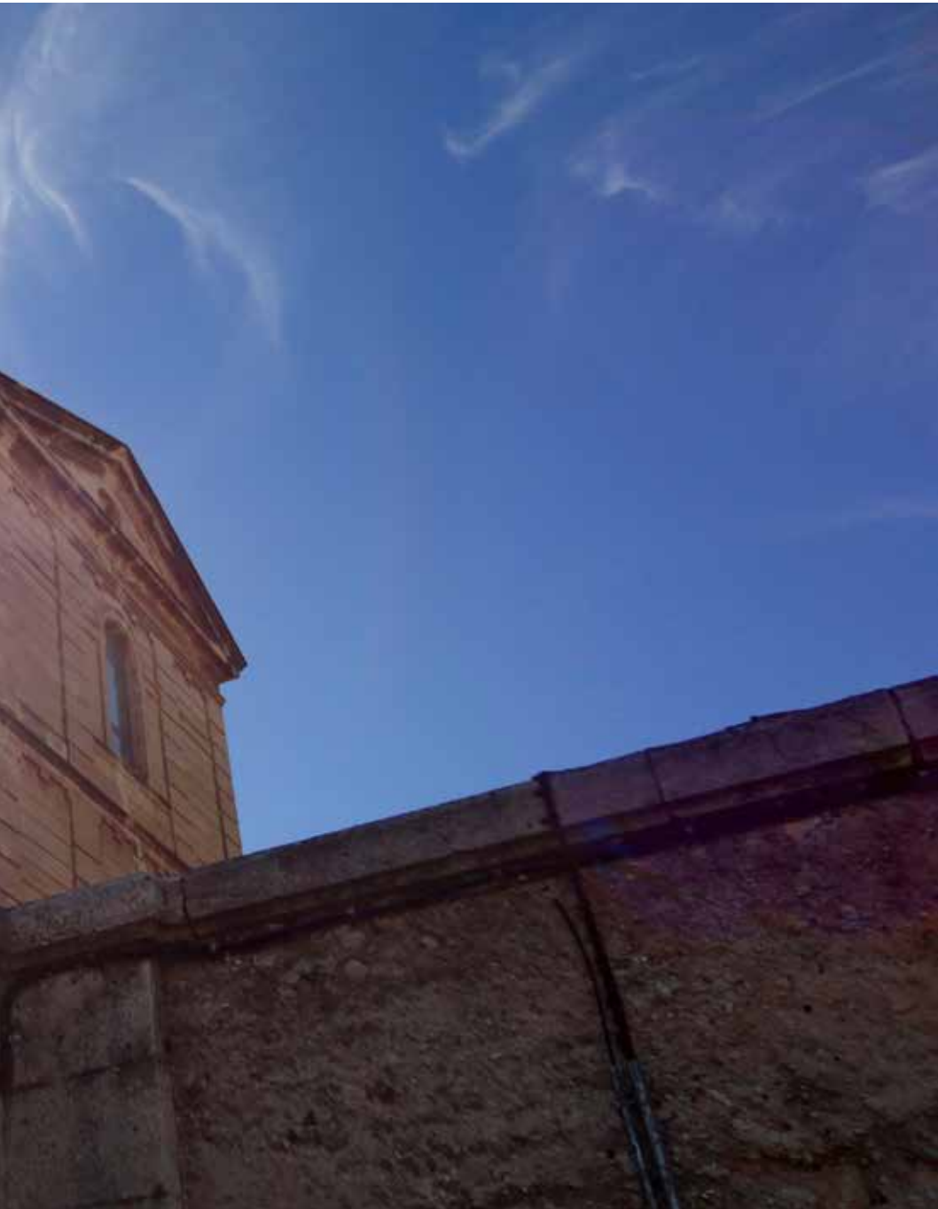
Sols és l'espai. Està ple d'espai