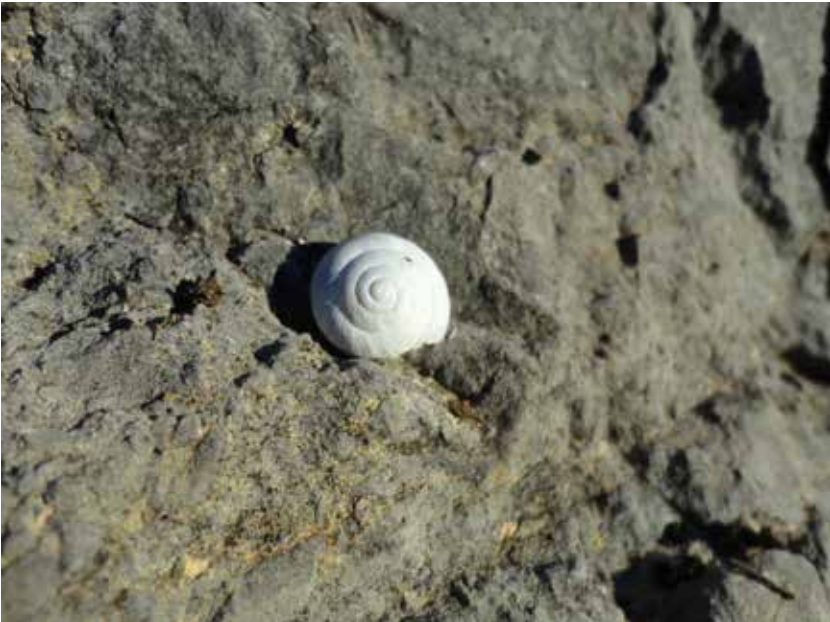
La poètica de el fet de existir dels espais