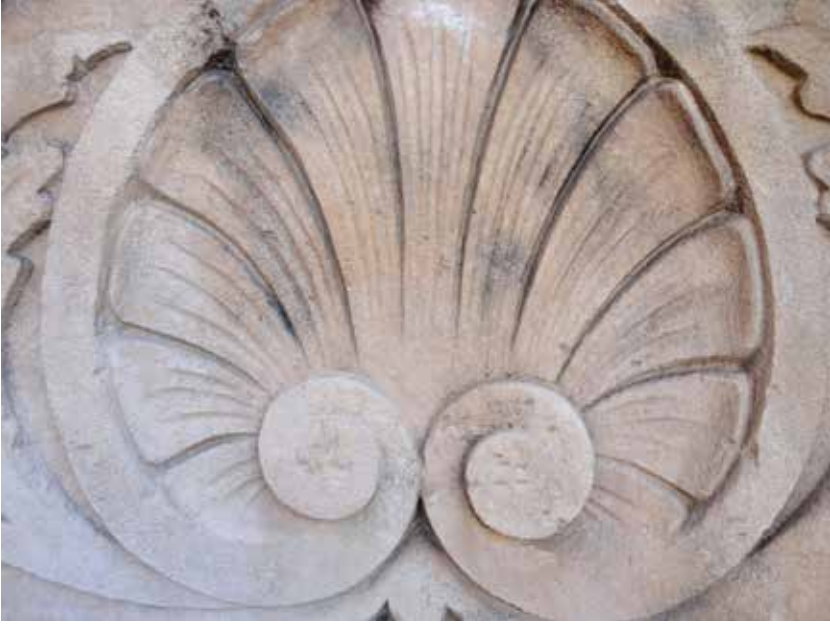
Identitat d'identitat de ser tot, l'Espai