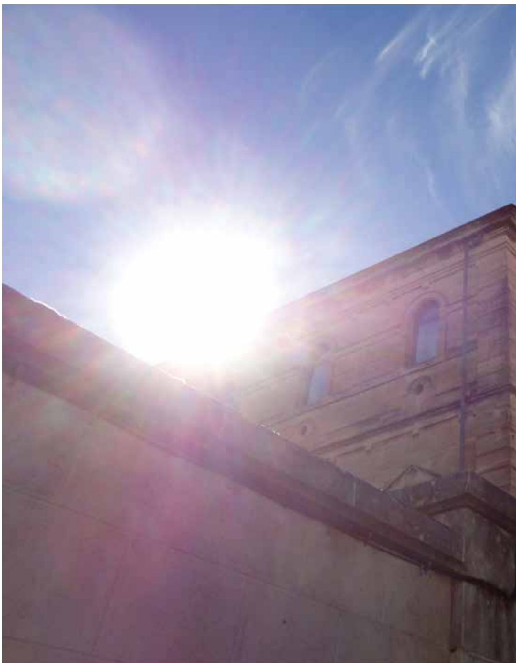
L'espai de l'Espai